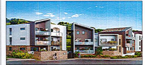
Résidence VERT AZUR